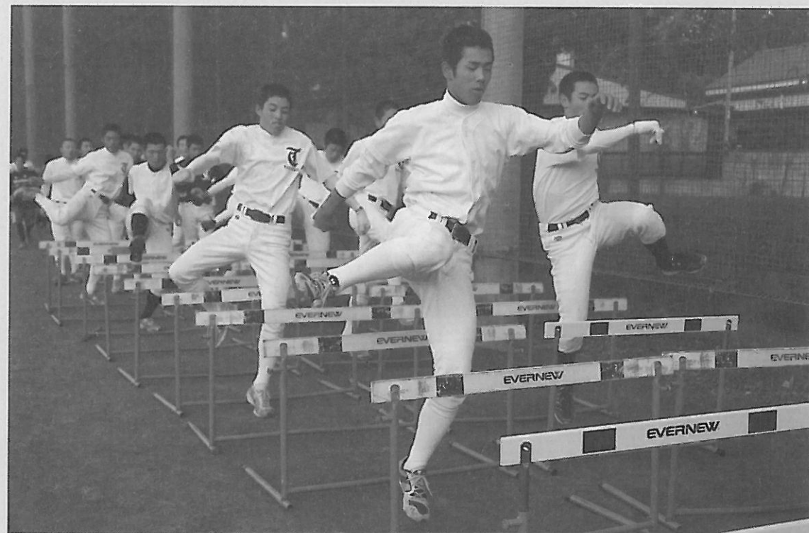
チームは自主性を重んじ、秋の群馬県大会では準優勝。関東大会でもベスト4に入った

そこからスタートした野球部も夏の大会で桐生第一高に善戦したり、地域の少年野球向けに野球教室を開催するなどして徐々に認知されるようになり、なんとか県で8強に入るところまで来ました。本当にさまざまなことがありましたが、このときにいろいろな経験をして引き出しが増えたことが今の指導にも何らかの