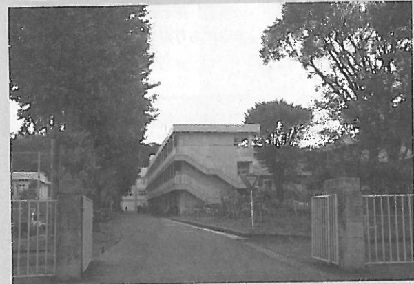
長い歴史を誇る県有数の進学校。センバツ出場となれば1981年以降の快挙となる

といわれても想像もつかないでしょうが、普段、教室にいるときから「君たちは世界で活躍する人材だ」という話をされますし、過去にそういう方が出ているというプライドと誇りは十分持っていると思います。