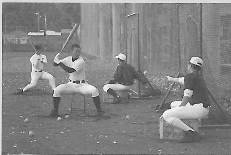
チームに合った練習法を見つけることが重要だと指揮官は語る

いろいろと変えていく過程で考えたのは、「なぜこれだけの歴史があって、自分たちの代だけが甲子園に行けたのか」ということでした。自分が2年の夏まではOBの方が監督をやっていて、ガチガチにやっていた。それが、学校の事情で新チームからは軟式の経験が少しあるという